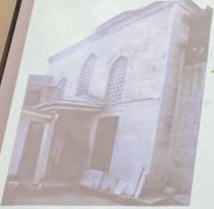
Müzenin Deposu olarak kullanılan Darülcüma'ra yapısı