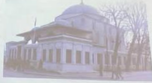
Sultan Ahmet Türbesi

Sultan Ahmed Külliyesi Planı https://islamansiklopedisi.org.tr/sultan-ahmed-cami-ve-kulliyesi (E.T. 20.11.2023)