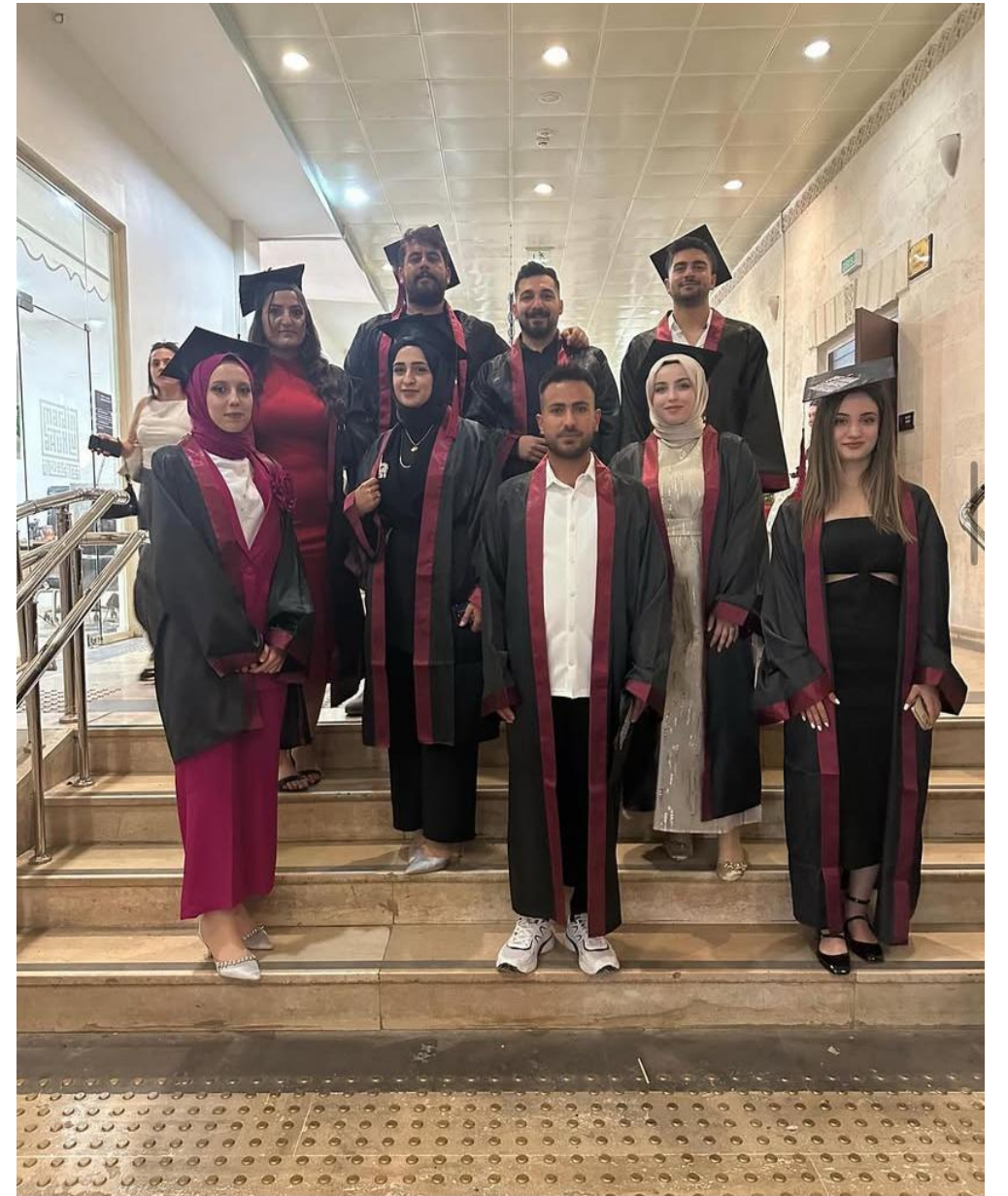
MARDİN ARTUKLU ÜNİVERSİTESİ SANAT TARİHİ BÖLÜMÜ ÖĞRENCİLERİMİZİN MEZUNİYET SEVİNCİNE ORTAK OLDUK.